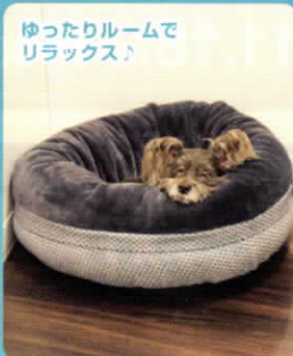
ゆったりルームで リラックス♪